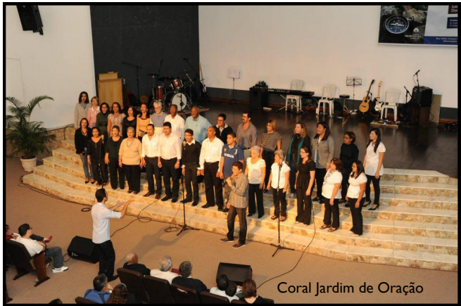
Coral Jardim de Oração