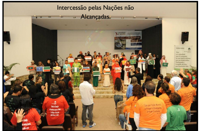
Intercessão pelas Nações não Alcançadas.