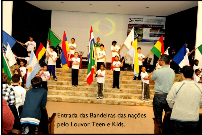
Entrada das Bandeiras das nações pelo Louvor Teen e Kids.