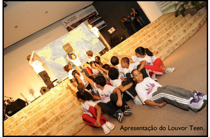
Apresentação do Louvor Teen.