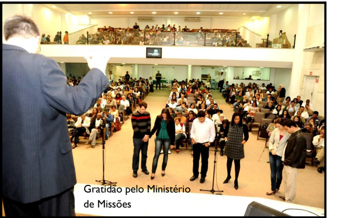
Gratidão pelo Ministério de Missões