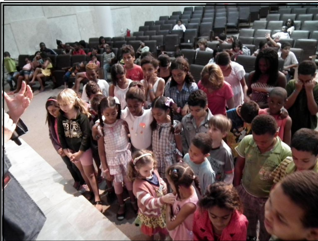
Um dos momentos mais tocantes da EFB foi quando as crianças foram convidadas a assumirem um compromisso com Jesus, entregando suas vidas e seus corações ao Senhor.