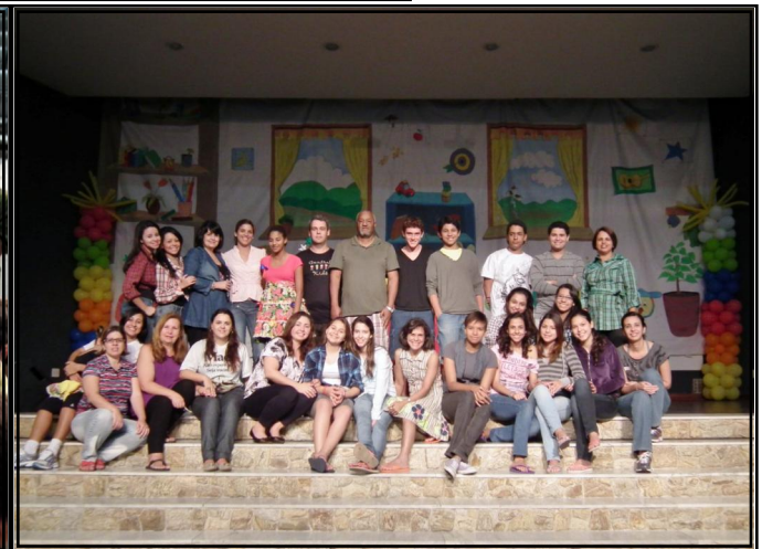
A EFB contou com muitos cooperadores que se revezaram no atendimento às crianças. A nossa profunda gratidão em nome da Igreja Presbiteriana de Macaé a todos vocês. Deus os abençoe.