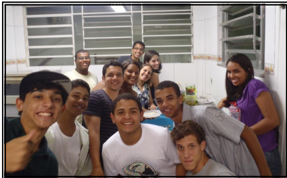
Esses são os cozinheiros, garçons e artistas que fizeram o jantar especial para as mães no dia 7 de maio.