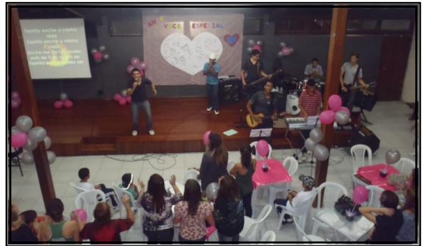
O Ministério da Juventude de nossa Igreja, UMP, UPA, promoveu no último sábado 7 de maio, uma homenagem às mães, com muita música, brincadeiras e um delicioso jantar.