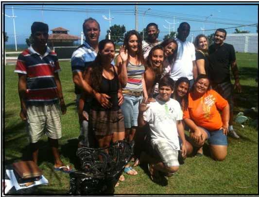
A Igreja Presbiteriana de Macaé realizou nos dias 15 a 17 de abril, o 4o Retiro de Formação Espiritual, no Praia Hotel Rio das Ostras, com a participação de 13 candidatos ao batismo e profissão de Fé, que deverão ser recebidos no próximo domingo, dia 15 de Maio.

Damos graças a Deus por mais essa colheita de sementes plantadas pelo ministério de células, pelo trabalho de cada líder que encorajou irmãos a se comprometerem com o Reino de Deus.