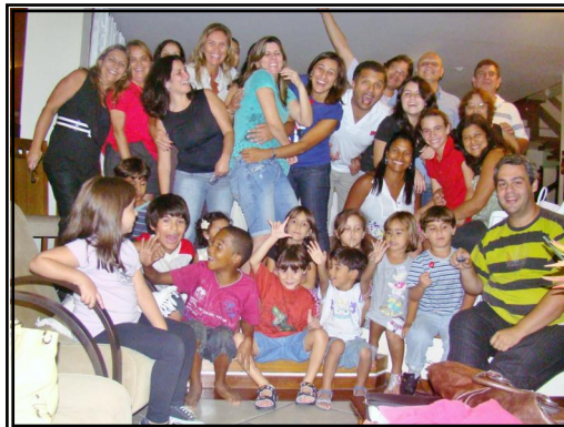
A Célula 16 numa noite cheia de alegria fez a foto acima, na semana que passou. Deus os abençoe.