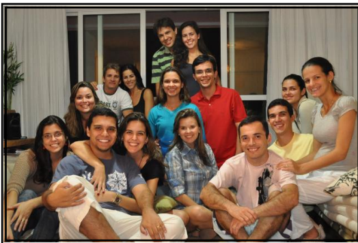
A Célula 24 aos poucos vai conquistando mais gente para o grupo. Que Deus os abençoe ricamente.