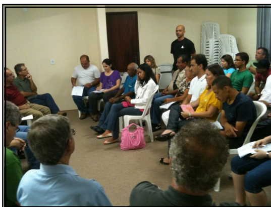
Na última 2ª feira, 8 de novembro, o Conselho da igreja examinou os candidatos a profissão de fé e batismo, vindos do último Retiro de Formação Espiritual. Muito choro, muita alegria, muita edificação. Deus seja louvado por essa grande vitória da Graça.

A Igreja Presbiteriana de Cabo Frio prepara o PROJETO MISSIONÁRIO CHILE 2011, de 5 a 27 de janeiro de 2011, que vai levar um grupo de 44 irmãos para realização de trabalhos evangelísticos e sociais em cinco cidades: