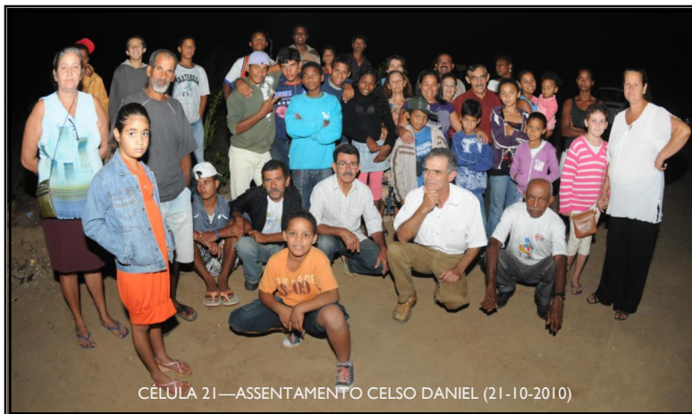
CÉLULA 21—ASSENTAMENTO CELSO DANIEL (21-10-2010)