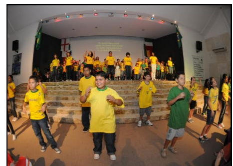
Louvor Kids e Louvor Teen participaram no domingo de manhã (12/9).