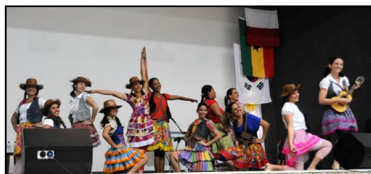
O ARMIT apresentou uma coreografia para uma música nordestina do grupo Sal da Terra, da IP de Garanhuns-PE.