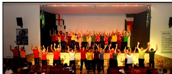
O Chamativa contagiou a todos com uma brilhante coreografia nos sábado à noite.