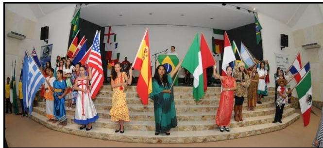
Abertura — Garotos e Garotas do Louvor Teen entraram com as bandeiras de vários países nações lembrando o amor de Deus p