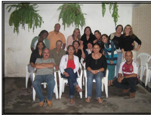
A Célula 18 continua crescendo no Parque Aeroporto, e em breve vai multiplicar-se.